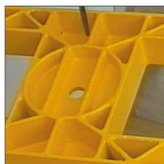
Corps en fonte à graphite sphéroïdal