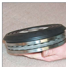
Palier à billes de plateau tournant