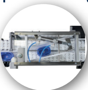
Dérivation par Godets