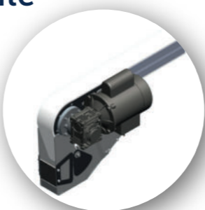
Tendeur de bande

Profitez des avantages du configurateur CAO le plus abouti du marché