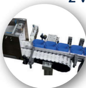
Butée d'arrêt Godets