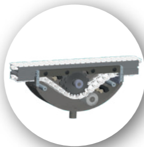
Nettoyage de chaîne à sec